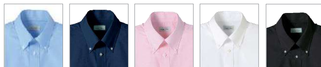
7ブルー 8ネイビー 9ピンク 15ホワイト 16ブラック