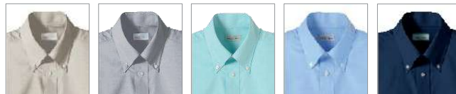
1ベージュ 2グレー 4ミント 7ブルー 8ネイビー