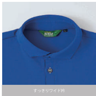
すっきりワイド衿