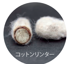
コットンリッター

キュブラはコットンを収 穫した後の種の周りのう ぶ毛を精製・溶解して作 る未利用繊維100%のエコ 繊維です。