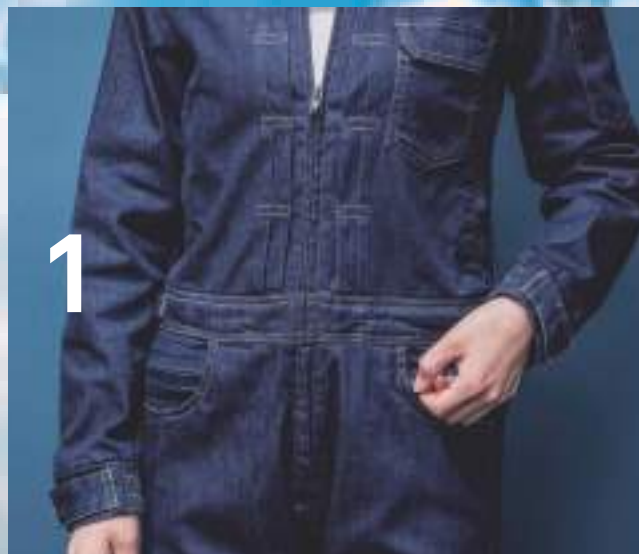
1 / 左右のポケット内にファスナースライダーがあります。