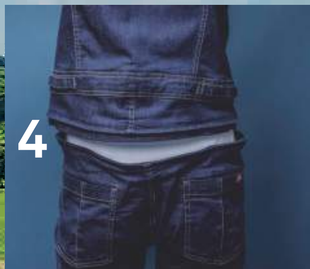
4 / ファスナーを全開にして完了です。ご使用ください。