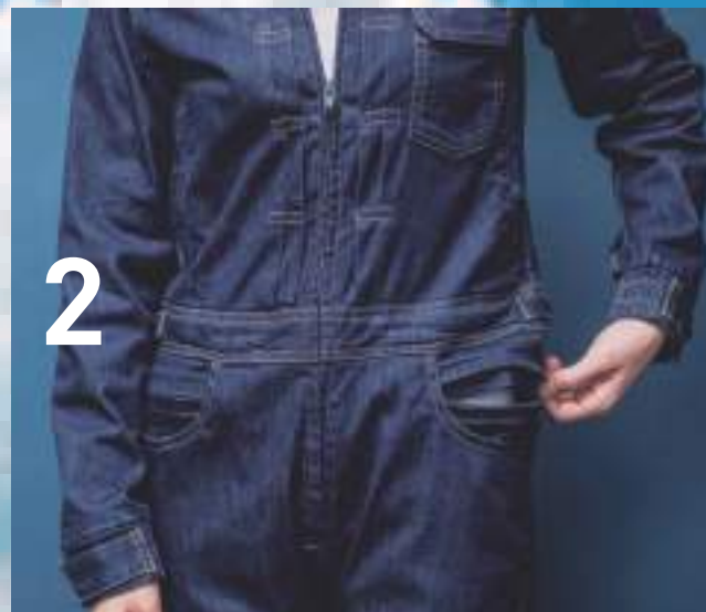
2 / どちか片方をスライドさせていきます。