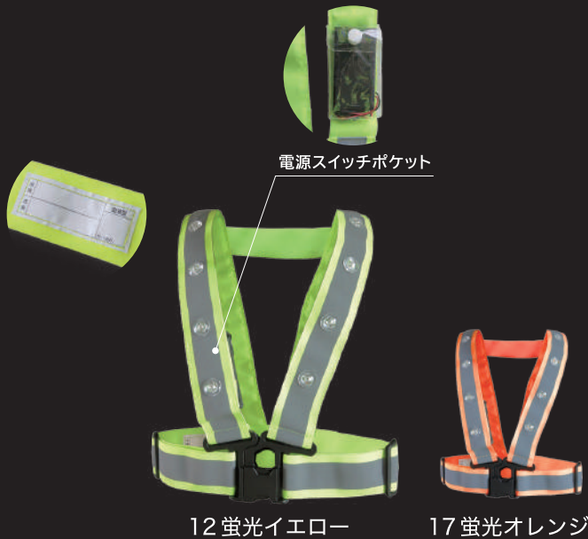
電源スイッチポケット