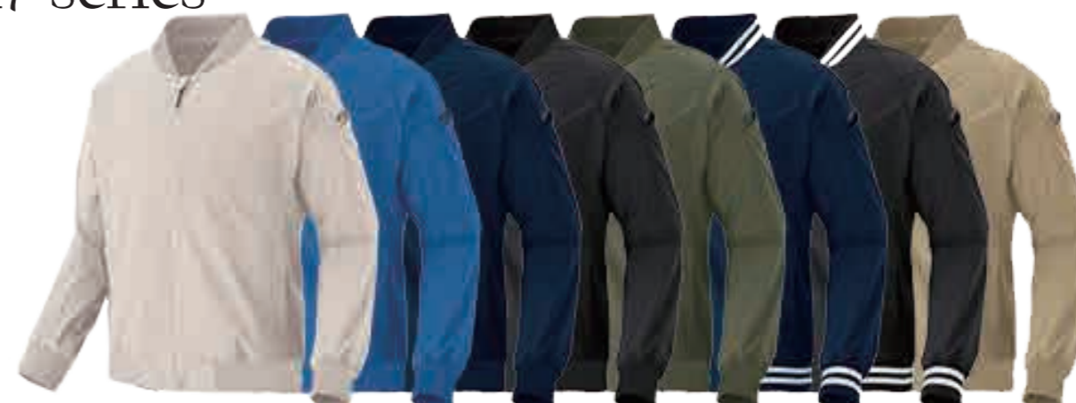
ライトグレー ブルー ネイビー ブラック カーキ ネイビーストライプ ブラックストライプ ライトカーキ