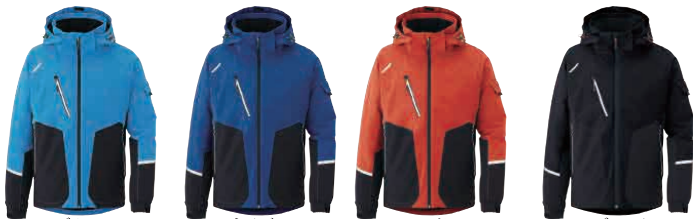
ブルー ネイビー レッド ブラック

ジャケット¥20,000 ポリエステルPUストレッチ (裏PUラミネート) ポリエステル92%・ポリウレタン8%