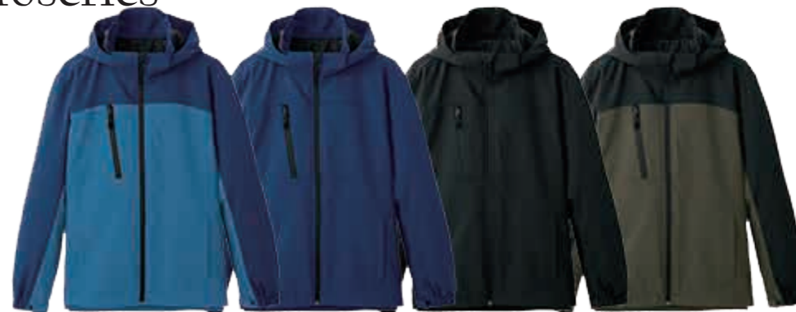
ブルー ネイビー ブラック カーキ

ジャケット¥9,800 ポリエステル100% 帯電防止 ストレッチ ECO素材 丸洗い可能