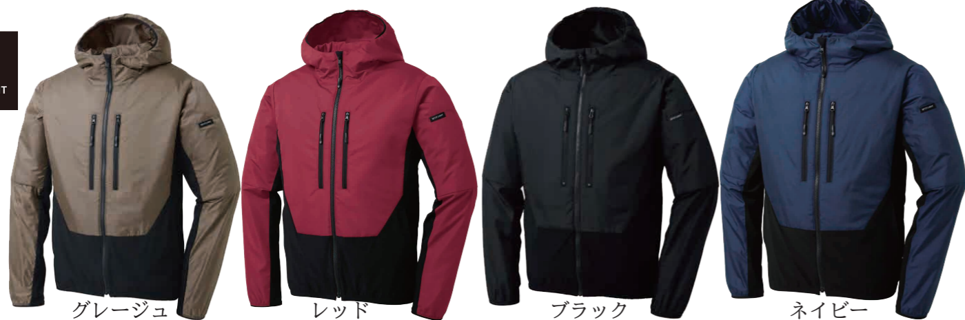
グレージュ レッド ブラック ネイビー