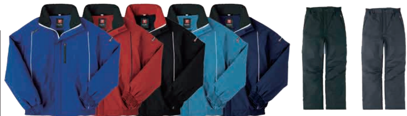
ロイヤルブルー レッド ブラック ターコイズ ネイビー ブラック チャコール