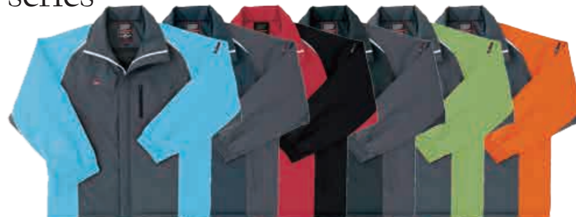
サックス×チャコール チャコール×ネイビー ブラック×レッド チャコール×ブラック ミントグリーン×チャコール オレンジ×チャコール